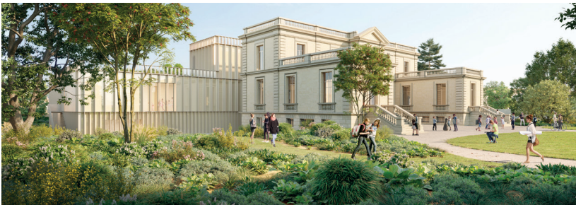
LE CHÂTEAU DES ARTS

La réalisation du Grand Peixotto-Margaut avance à grand pas : après les travaux sur le château Margaut c'est le château Peixotto qui fait aujourd'hui l'objet de toutes les attentions. Au printemps 2026, c'est un tout nouvel espace de respiration, un parc unique en cœur de ville qui s'ouvrira à tous.