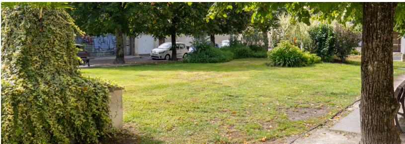
PLACE ALBERT THOMAS

Les travaux d'aménagement de la gare Talence-Médoquine se poursuivent : les quais et la passerelle seront installés au premier semestre 2025. À proximité immédiate du CHU et du campus, elle sera un maillon essentiel du RER métropolitain et des déplacements quotidiens. Intégrée à terme au cœur d'un pôle multimodal, irrigué par le futur Bus Express mis en service en 2027, son ouverture est prévue en septembre 2025.