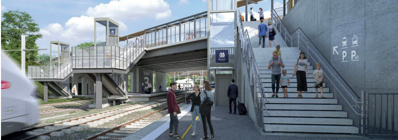
HALTE FERROVIAIRE DE LA MÉDOQUINE

Les travaux d'aménagement de la gare Talence-Médoquine se poursuivent : les quais et la passerelle seront installés au premier semestre 2025. À proximité immédiate du CHU et du campus, elle sera un maillon essentiel du RER métropolitain et des déplacements quotidiens. Intégrée à terme au cœur d'un pôle multimodal, irrigué par le futur Bus Express mis en service en 2027, son ouverture est prévue en septembre 2025.