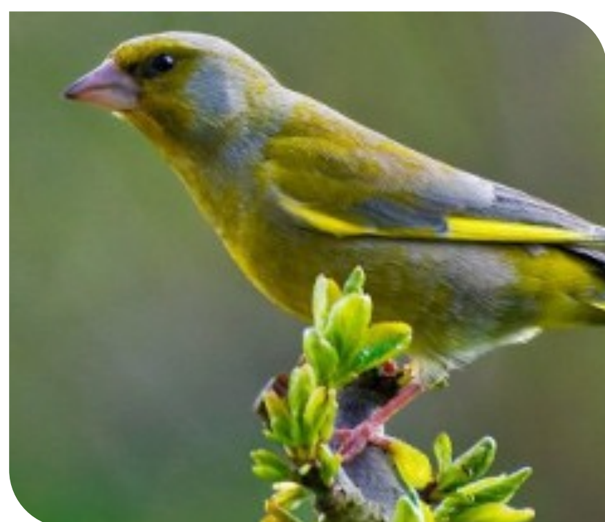
Verdier d'Europe Chloris chloris

Parmi les espèces d'oiseaux recensées, deux sont classées vulnérables : le chardonneret élégant et le verdier d'Europe appartenant à la famille des fringillidés (petits passereaux au bec conique granivore et partiellement insectivores). Un déclin constaté de près de 40% sur ces dix dernières années.