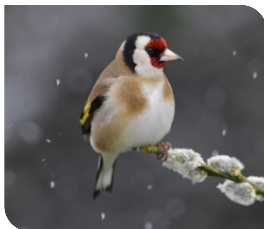
Chardonneret élégant Carduelis carduelis