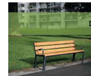
DÉTENTE - CONVIVIALITÉ