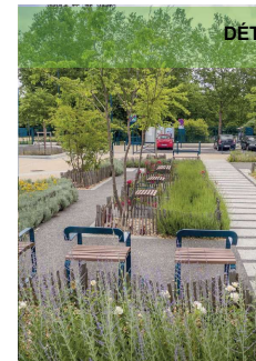
DÉTENTE ET CONVIVIALITÉ