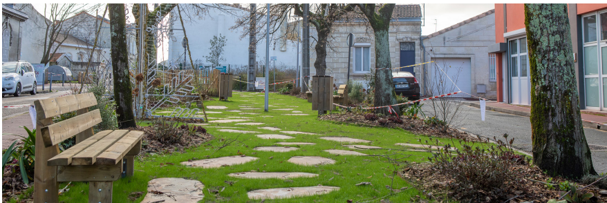
RÉHABILITATION DE LA PLACE ÉMILE ZOLA

Une nouvelle table de tennis de table ainsi qu'un nouveau panier de basket vont agrémenter l'aire de jeux du square pour en faire plus encore un lieu de vie et de rencontres au coeur de votre quartier.