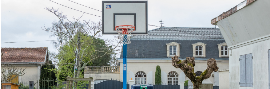
DANS VOTRE QUARTIER

Une nouvelle table de tennis de table ainsi qu'un nouveau panier de basket vont agrémenter l'aire de jeux du square pour en faire plus encore un lieu de vie et de rencontres au coeur de votre quartier.